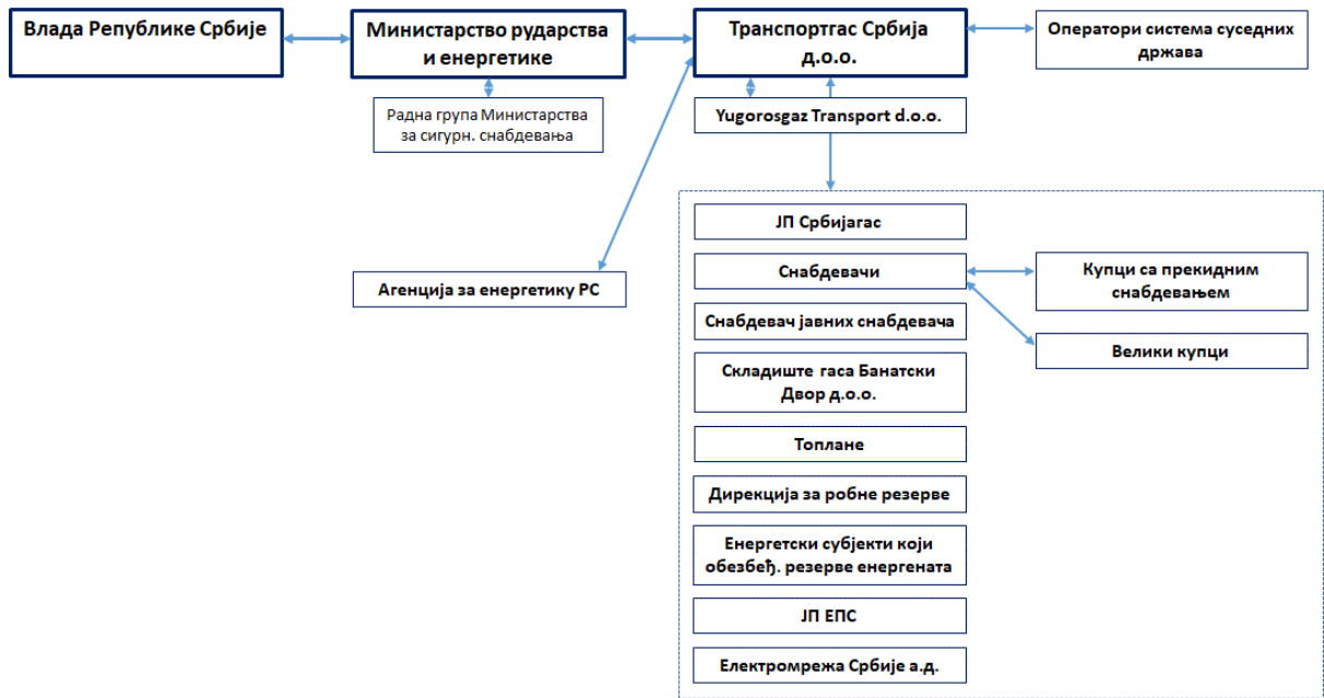
Слика 3: Одговорне стране и ток информација при Нивоу 3 кризе